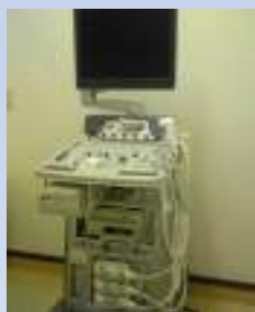
②G・E社(アメリカ製) 超音波診断装置