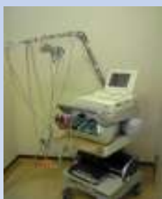
③フクダ電子社 CAVI・ABI装置